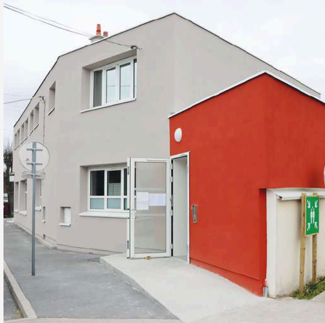
Centre social Agora, Terre des hommes - Cochet, J. (2024, 13 mai). Un nouveau lieu pour Tous : AGORA Terre des hommes. Ville de Montfermeil. https://www.ville-montfermeil.fr/un-nouveau-centre-social-a-montfermeil

Comment Agora, Terre des hommes met en place un accueil pour les seniors afin de favoriser leur participation et leur intégration sociale dans la création de projet intergénérationnel ?