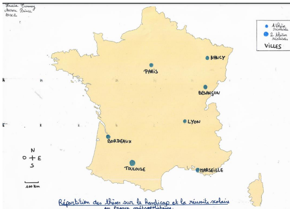
Carte réalisée à la main par nous même à partir d'un fond de carte Magrit imprimé et qui illustre la répartition des thèses réalisées sur le handicap et la réussite scolaire en France

s'intéressaient au handicap et au lien avec l'école de manière générale et ce en France. Cela nous a amené à sélectionner neuf thèses que nous avons répertoriées sur une carte de France afin de savoir où ont été soutenu les recherches sur le sujet qui nous intéresse, au sens large.