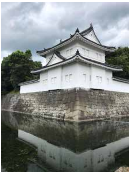
D. Peeters / Palais impérial de Tokyo

Pour rentrer plus dans le détail, le Japon est un pays sensationnel de par ses paysages et ses édifices. En effet, le mont Fuji, le temple Fushimi Inari-tashi, le château d'Osaka, des merveilles aussi différentes les unes des autres qui émerveillent rien qu'au premier regard!