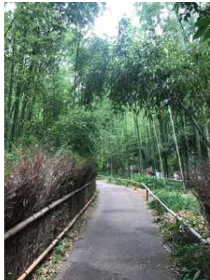
D. Peeters / Arashiyama

Les temples vous remémoreront vos dessins animés d'enfance, comme Mulan. Les fans de mangas trouveront également leur bonheur dans cette caverne d'Ali Baba !