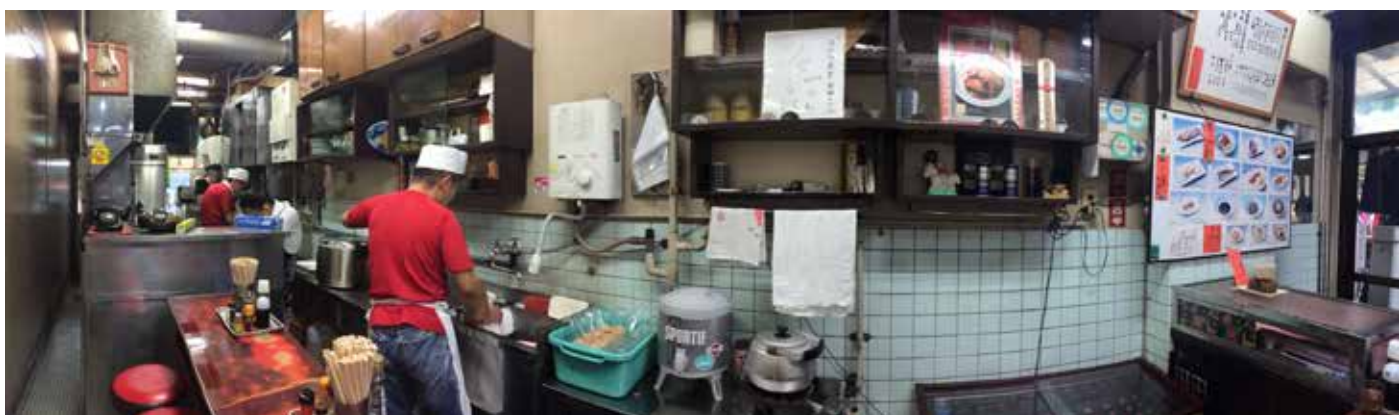
F. Froger / D5 / Restaurant de pêcheurs