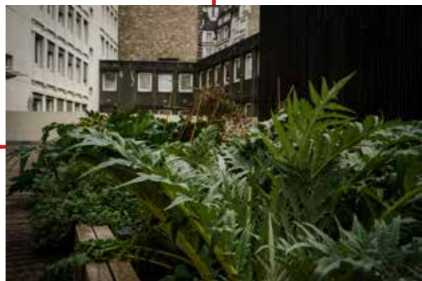
A. Veron / Jardin Partagé