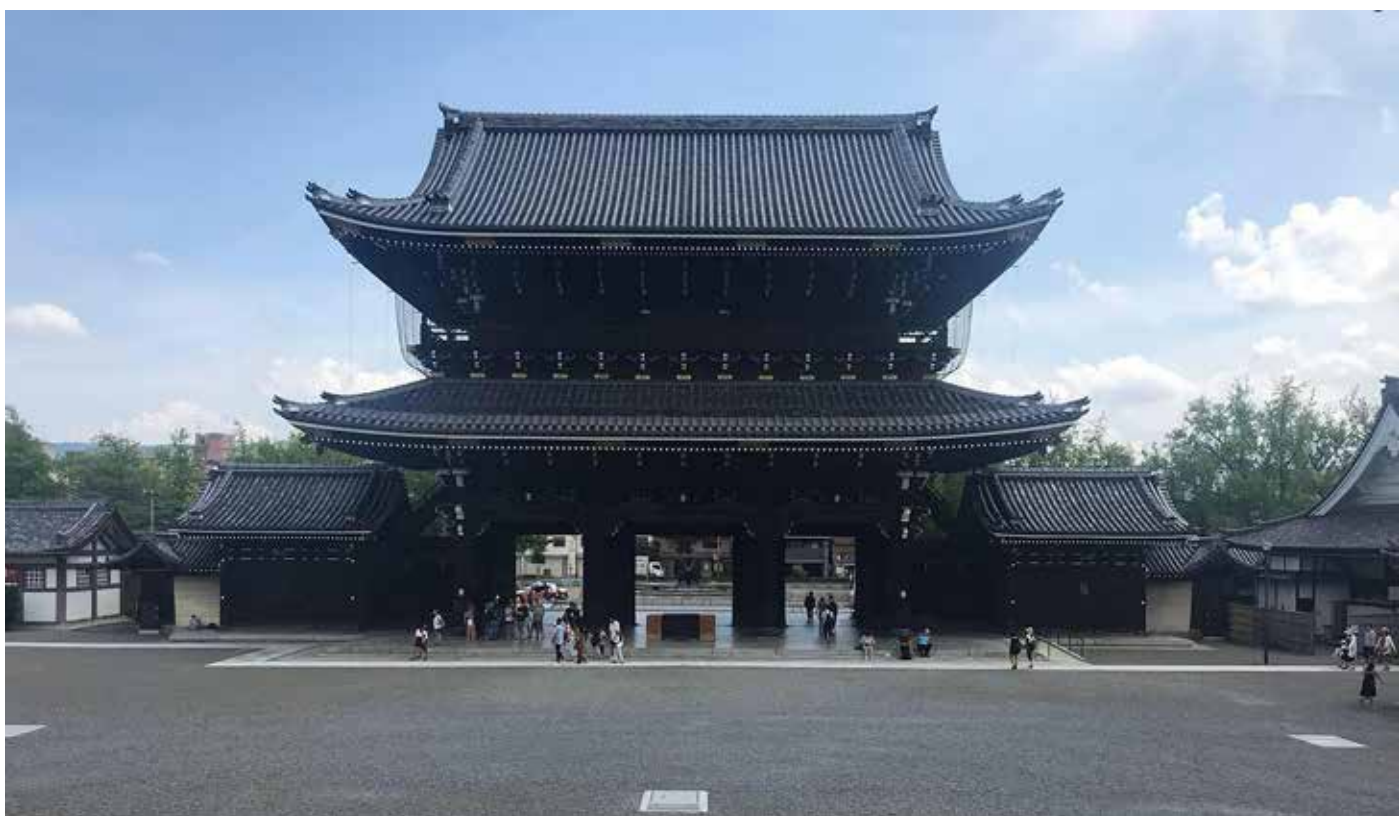
D.Peeters / Nanzen-ji

Ce qui fait également la caractéristique du Japon, c'est bien évidemment sa nourriture. Et quelle nourriture! Sushis, makis, ramen, nouilles au soba, pour tous les goûts, dans toutes les couleurs. Vous pouvez trouver des nouilles au soba vertes!