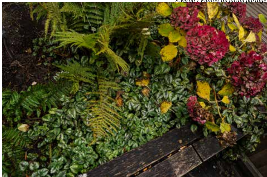
A. Veron / Plantes du jardin partagé

En effet, enseignants, élèves ou membres du personnel encadrant sont invités à découvrir tout ceci lors de différents ateliers qui auront lieu lorsque le beau temps sera de retour. Les étudiants de Carrières Sociales sont les premiers concernés, puisqu'ils disposent de 12h de cours dans ce jardin, pour faire naître leur projet prêt des roses René Descartes ! Les années précédentes, ils nous ont offert des citrouilles, du cassis et de la menthe, qu'ils avaient utilisés pour faire de la soupe et du sirop ! Magique, non?!