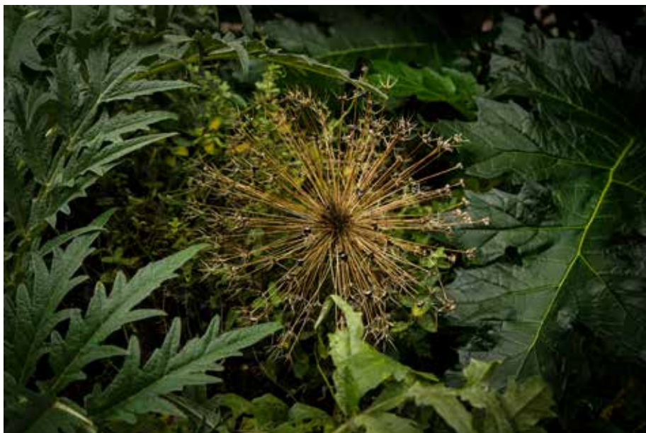
A. Veron / Plante du jardin partagé

L'IUT a fait appel à elle pendant l'inauguration des amphithéâtres dans le cadre des 1% artistiques (une loi qui, depuis 1951, impose d'accorder 1% du budget total d'une construction publique à une réalisation artistique). D'ailleurs, le muret un peu déstructuré qui nous sépare des gamins braillards d'à côté, il vient de là.