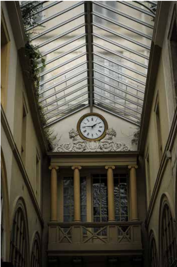
A. Veron / Passage des panoramas

Cependant, avec les travaux d'Haussmann et la concurrence des grands magasins, qui ont fait de l'ombre à ces galeries habitant de petits commerces et restaurants, bon nombre d'entre elles ont disparu. Voici tout de même une liste non exhaustive de passages où chacun pourra trouver son compte... Un incontournable pour les passionnés en tous genres !