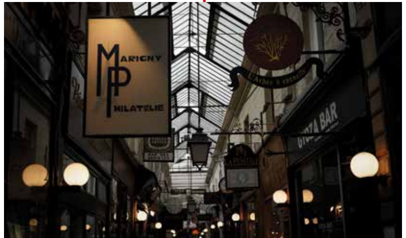
A. Veron / Passage des panoramas