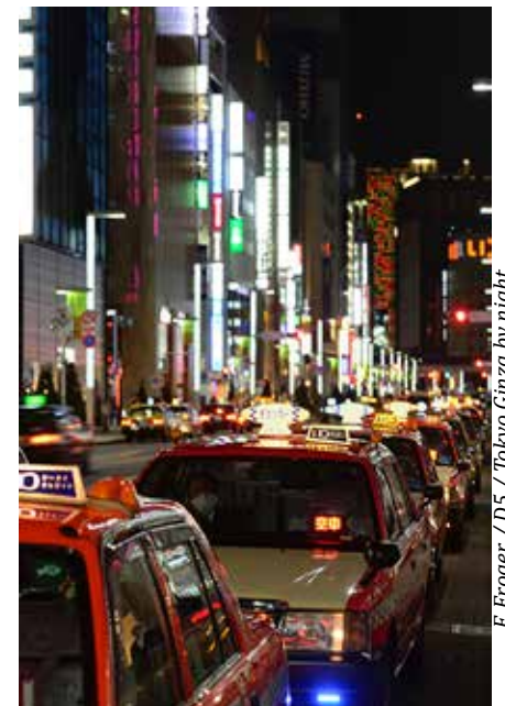
F. Froger / D5 / Tokyo Ginza by night

Le Japon, c'est aussi ses geishas, geishas qu'on ne voit que très rarement dans les rues d'ailleurs! Ces dernières se cachent du grand public, et vivent généralement en communauté. Ce qui est dommage néanmoins, c'est que les touristes ont tendance à s'acheter des kimonos et à se faire passer pour des geishas, car vous savez, rien de tel qu'une belle photo de soi en kimono pour amplifier le nombre de coeurs rouges sur Instagram!